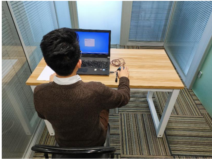
图二：电脑端背面视角