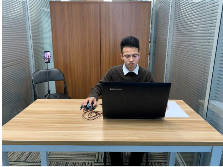
图一：电脑端正面视角