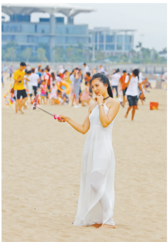
昨日傍晚暑气渐消,不少市民游客来到会展海边游玩。