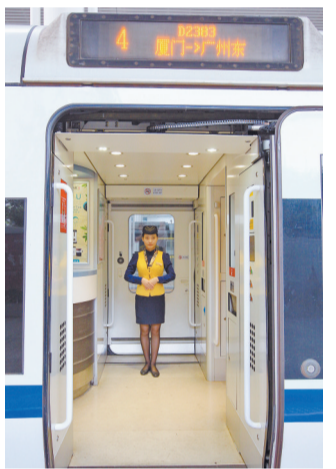
一位动姐站在厦门至广州东D2383次动车上。

昨日也是暑运第一天,暑运将持续到8月31日,预计发送旅客约550万人次,增幅达5.8%,学生、游客将是旅客主力。