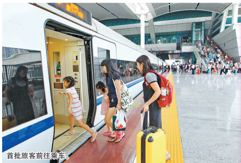
首批旅客前往乘车。